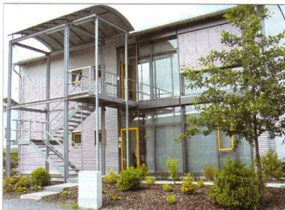
Das Firmengebäude der Firma Bauer + Kirch GmbH

N.O.S. News-Office-System optimiert alltägliche Abläufe und erweitert die Funktionen einer zeitgemäßen Periodikaverwaltung